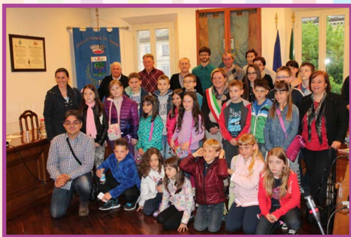
U posjeti kod gradonačelnice Marano Sul Panaro